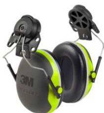
NRR 25 dB X-Series X4 adaptable a casco. Modelo X4P3E. SKU: XA007707913