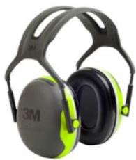
NRR 27 dB X-Series X4 con banda superior. Modelo X4A. SKU: XA007707863